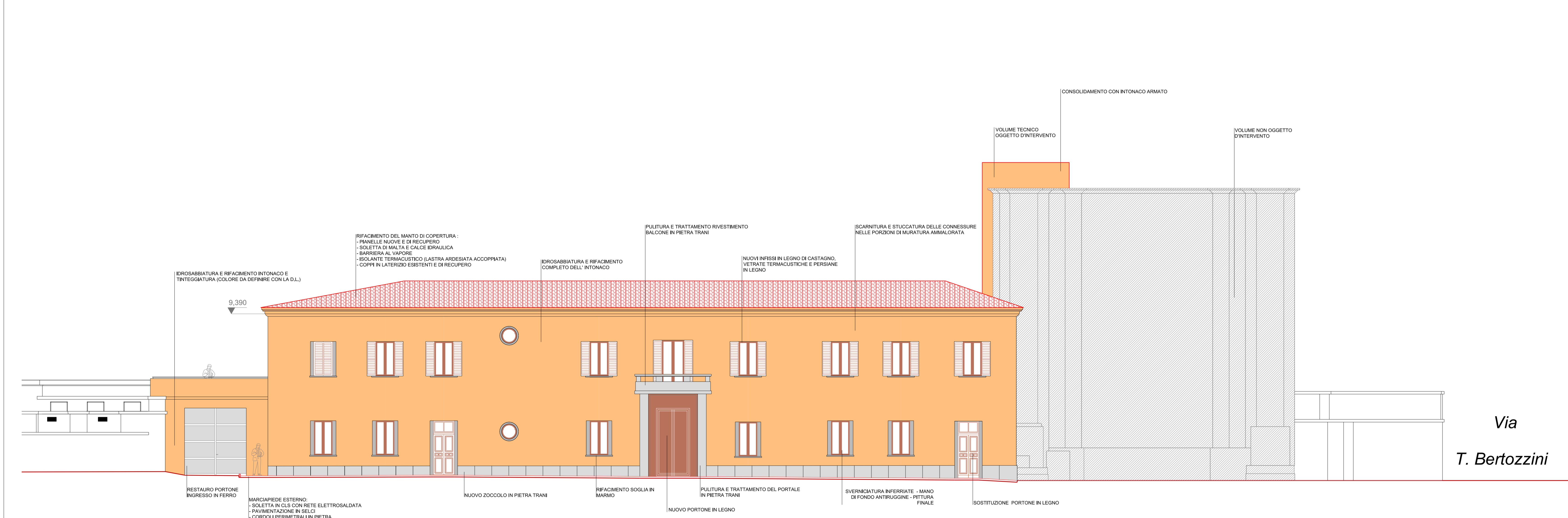
PROSPETTO "A" (Via Luca Della Robbia)