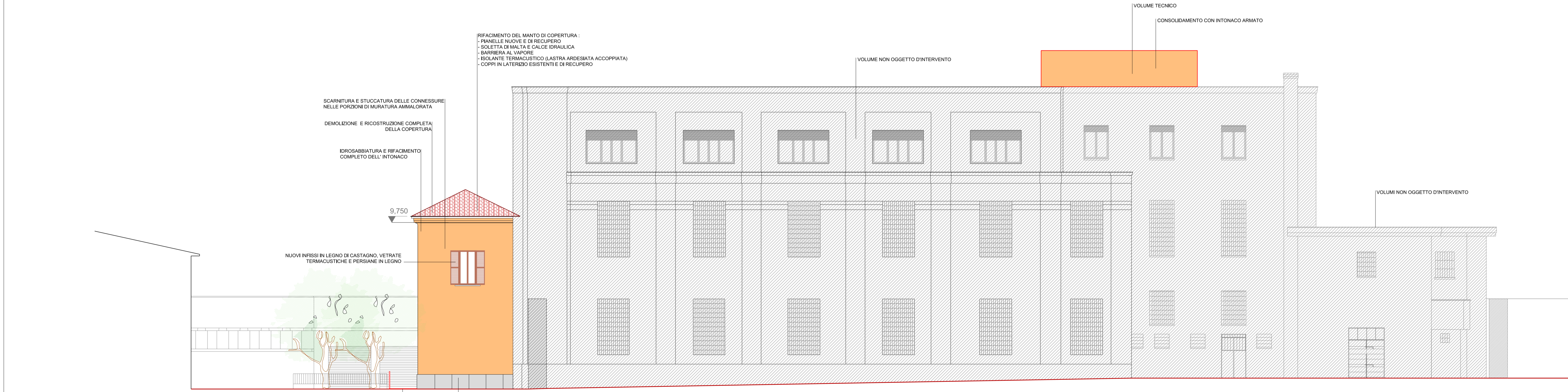
PROSPETTO "D" (Via Bertozzini)