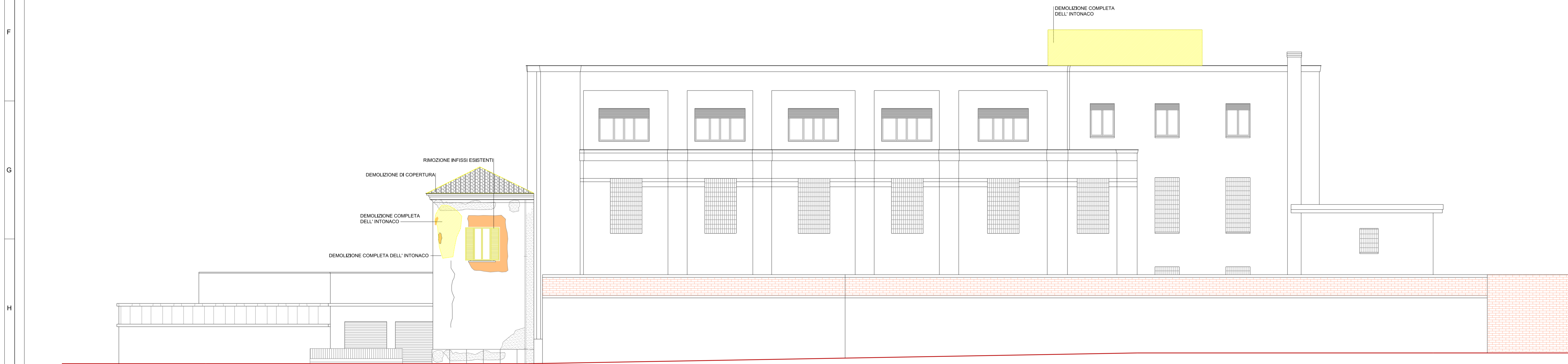
PROSPETTO "D" (Via Bertozzini)