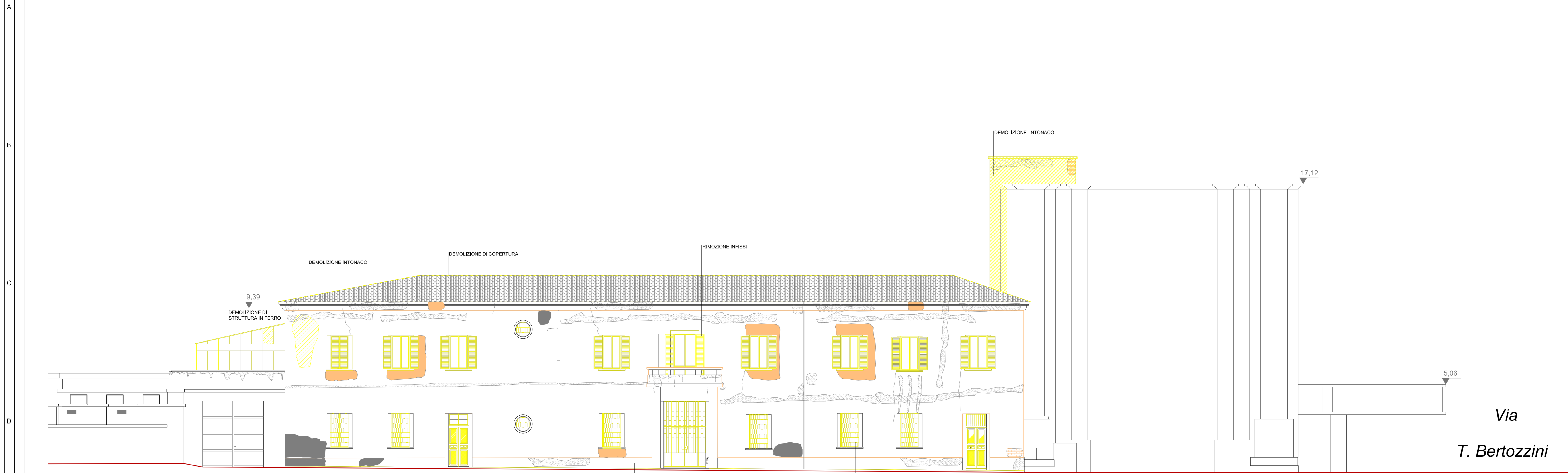
PROSPETTO "A" (Via Luca Della Robbia)