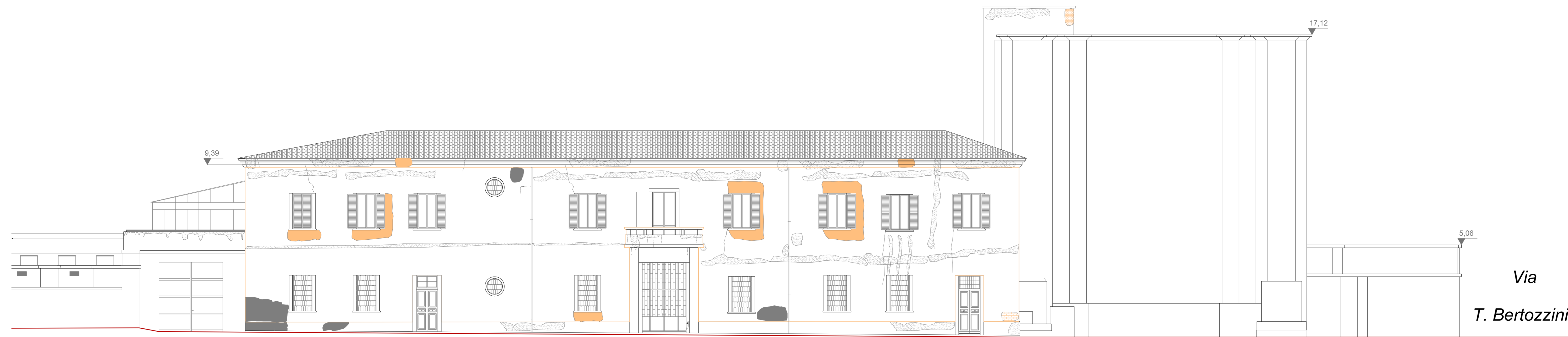
PROSPETTO "A" (Via Luca Della Robbia)