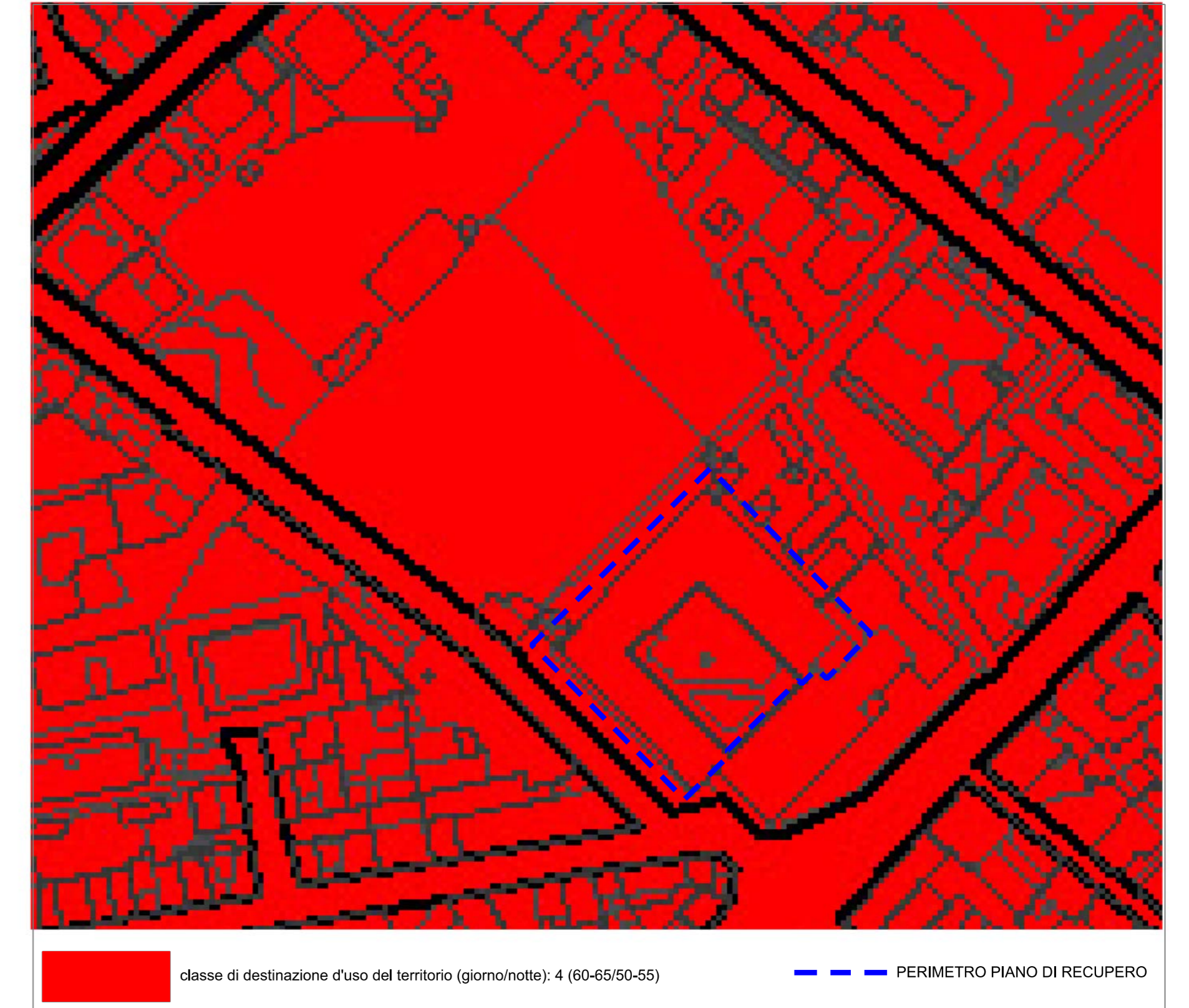
STRALCIO CENTRO STORICO - classificazione acustica