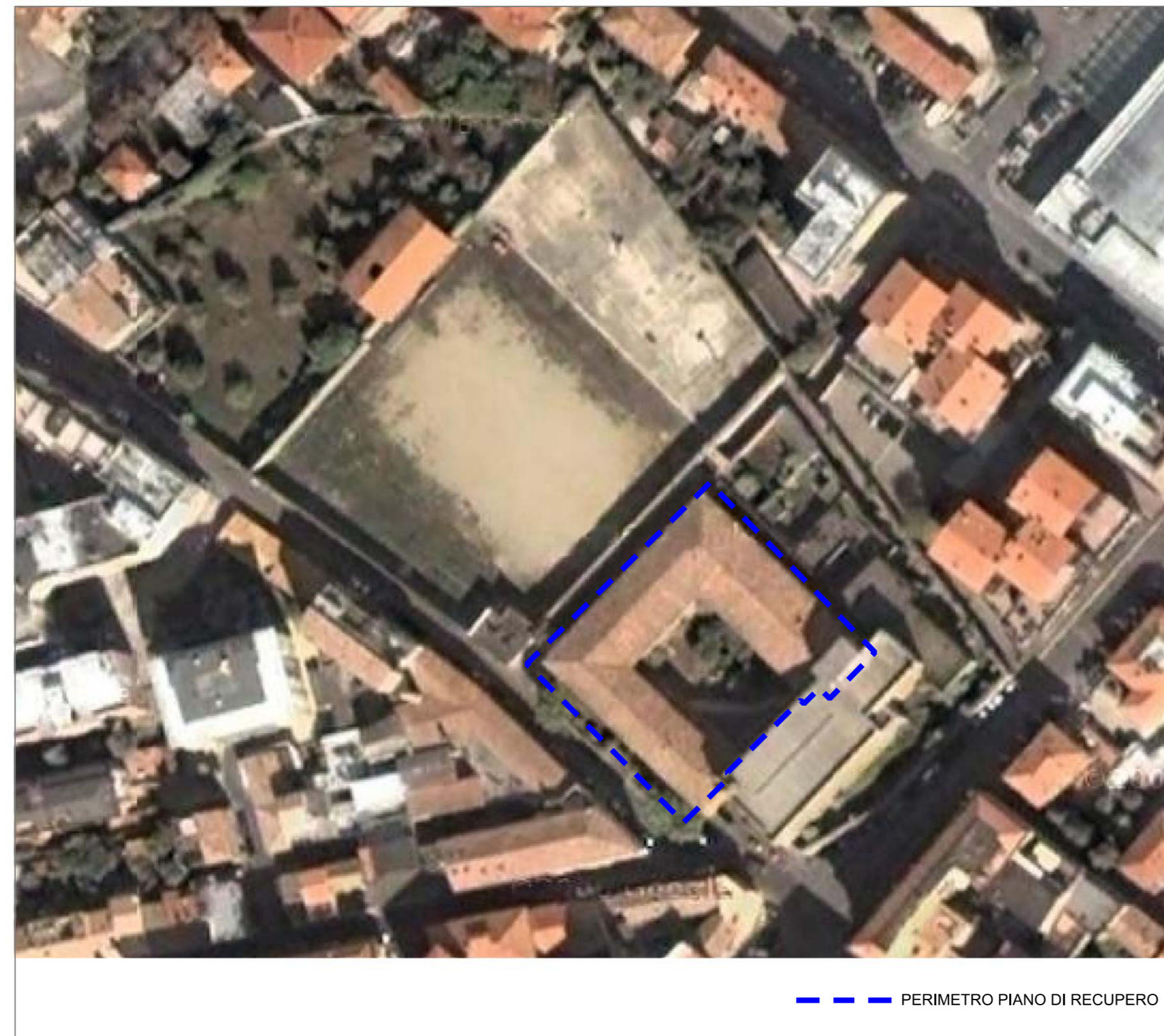
FOTO AEREA CENTRO STORICO DI PESARO